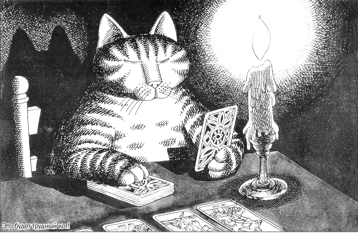
Это будет трудный кот!

Откуда же карты Таро берут истоки? Можно встретить утверждения, что они использовались для предсказаний едва ли не со времен Всемирного потопы, если не ранее. Однако по одной из распространенных гипотез, колода Таро была общим предшественником для всех европейских игральные колоды. Как считается на основе большинства современных исследований, карты Таро