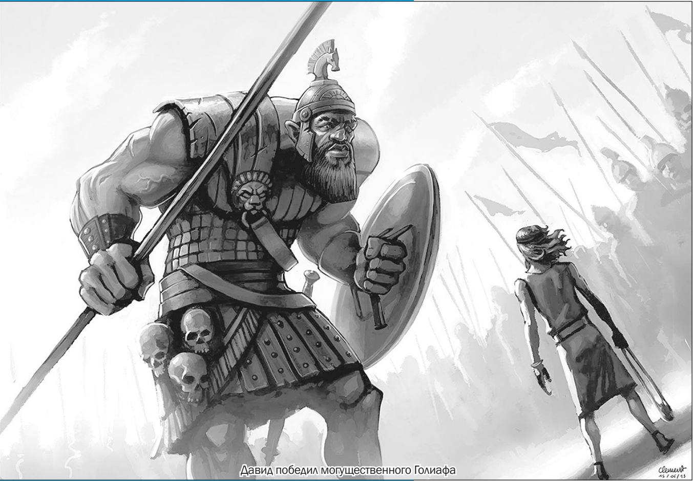
Давид победил могущественного Голиафа