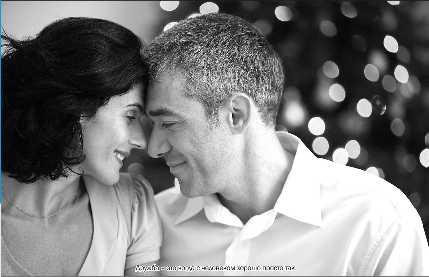
Дружба — это когда с человеком хорошо просто так

Иногда мы называем друзьями старых знакомых. Зачастую дружбу путают с приятельством. Само слово «приятель» подразумевает человека, с которым мне приятно и хорошо проводить время, разделять какое-то хобби или отдыхать. С приятелем мы можем ходить в баню или в горы, поболтать